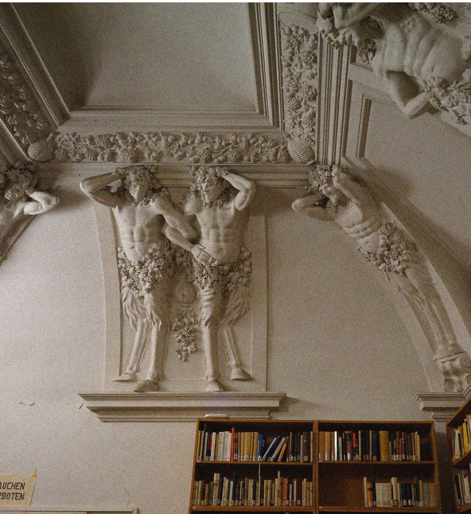
Bonner Romanistik Bibliothek